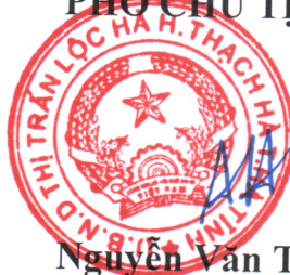
Nguyễn Văn Thiệu

TM. ỦY BAN NHÂN DÂN KT. CHỦ TỊCH PHÓ CHỦ TỊCH